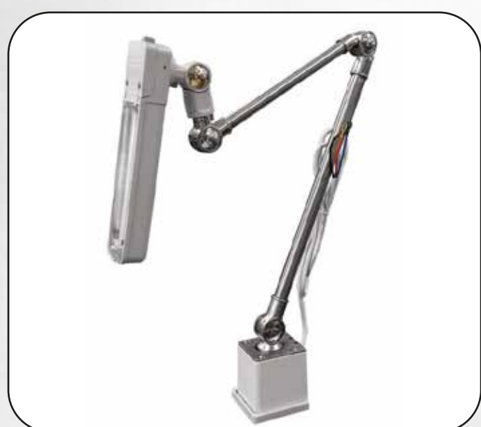
FOCO LED GRANDE ART.16921