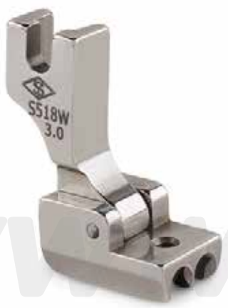
PIE CIERRE NORMAL IZQ/DER