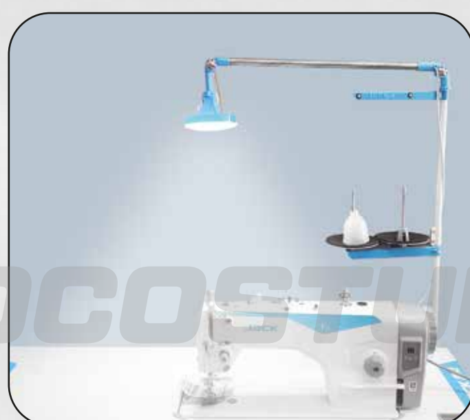
FOCO LED (GRANDE) ART.29832