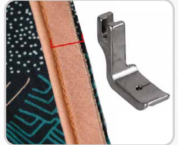
PIE PARA VIVO (MEDIDAS VARIAS)