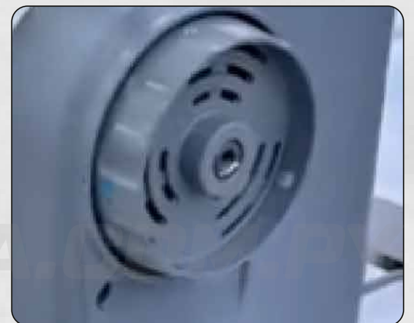
DISPONE DE MOTOR SERVO