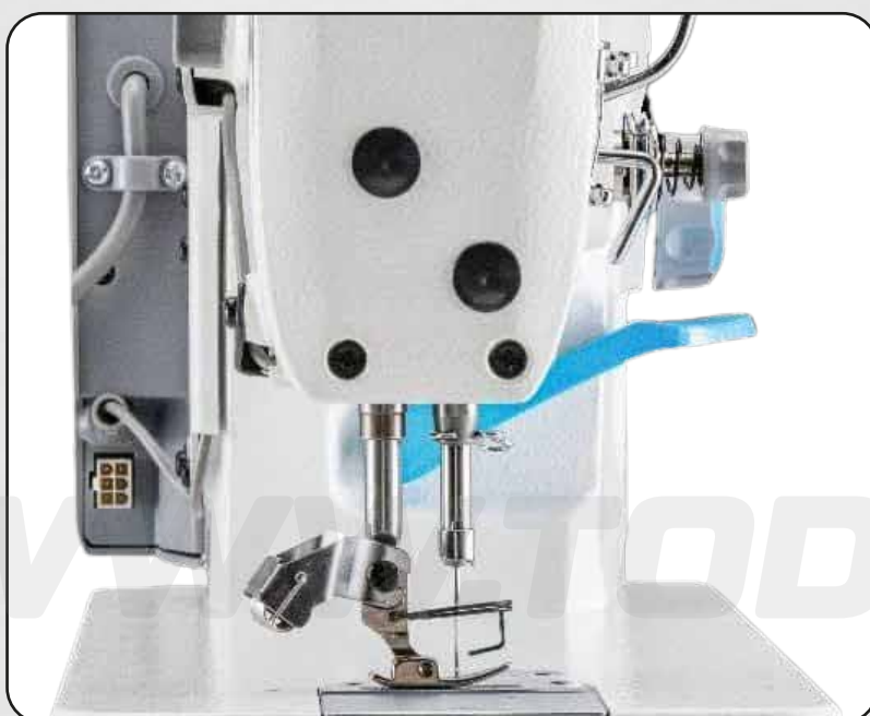
ALTURA DE PRENSATELA: 5 A 13 MM

ALTURA DEL PRENSATELA AJUSTABLE DE 5 A 13 MM - MOTOR SERVO AHORRO DE HASTA UN 80% DE ENERGÍA - VELOCIDAD REGULABLE HASTA 5.000 RPM - PANEL ELECTRÓNICO - LUZ LED.