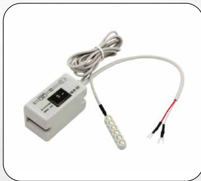
FOCO (B) LED WILLPEX (CON LLAVE) ART.16819