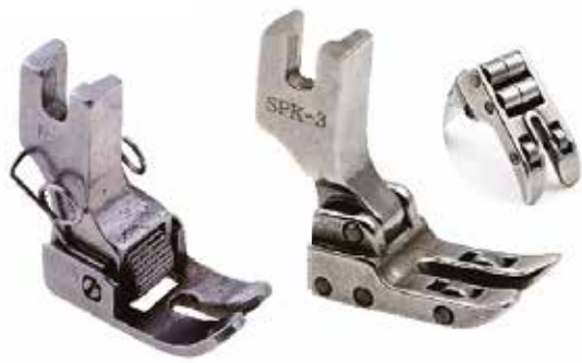
PIE CON RODILLO (PARA MEJOR ARRASTRE)