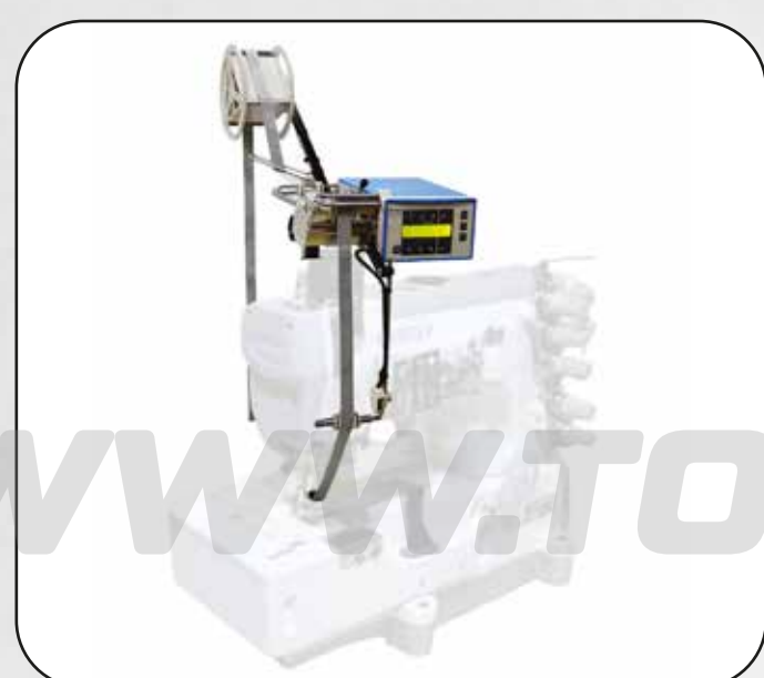
ALIMENTADOR DE BIES PARA ELÁSTICOS / CINTAS ART.16921