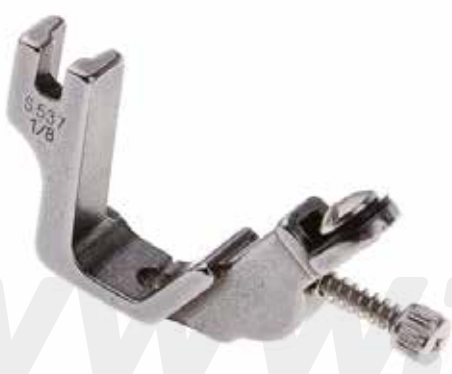
PIE PARA AÑADIR ELÁSTICO (MEDIDAS VARIAS)