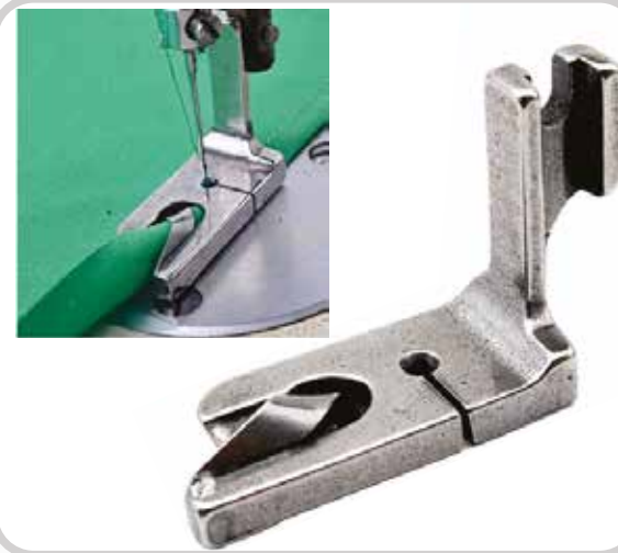
PIE PARA DOBLADILLADOR (VARIAS MEDIDAS)