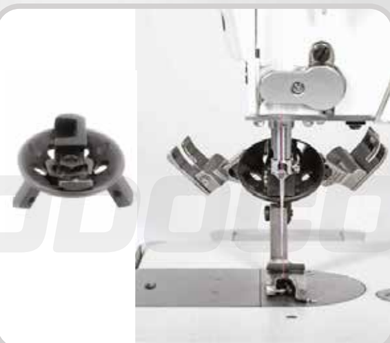
SOPORTE DE PRENSATELA (3 EN 1)