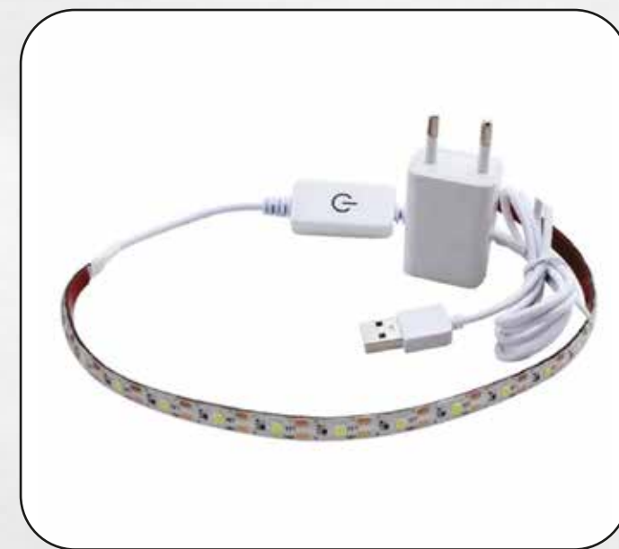
FOCO CINTA LED ART.29798