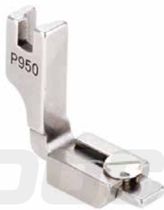
PIE PARA FRUNCIR (AJUSTABLE)