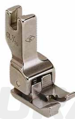
PIE COMPENSADO (VARIAS MEDIDAS)