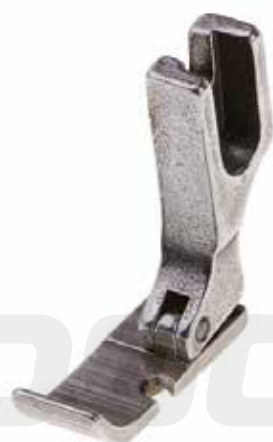
PIE PARA CIERRE INVISIBLE