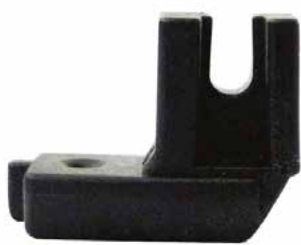
PRENSATELA CIERRE INVISIBLE (TEFLÓN)