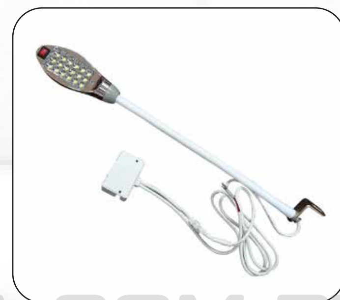
FOCO (18 LED) ART.13320