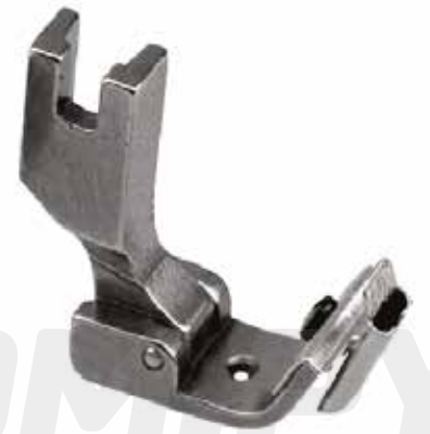
PRENSATELA PARA CINTA (AJUSTABLE)