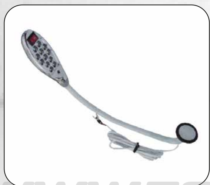
FOCO 12 LED CON IMÁN ART.14644