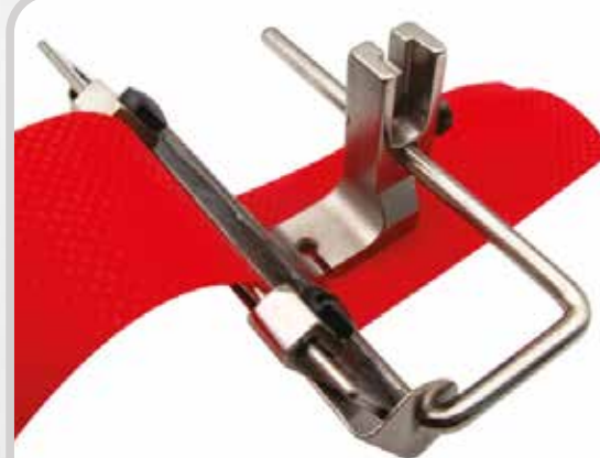
PRENSATELA AJUSTABLE PARA TIRAS