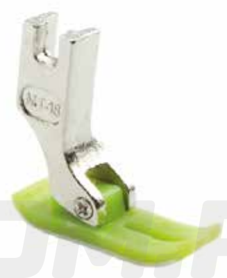
PIE DE TEFLÓN