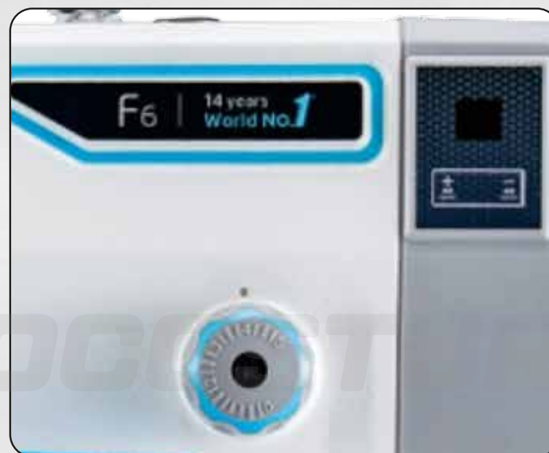
PANEL ELECTRÓNICO INTEGRADO EN EL VOLANTE