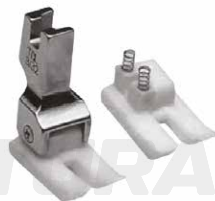
PRENSATELA COMPENSADO (TEFLÓN)