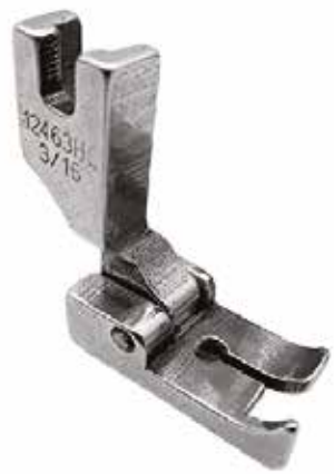
PIE CON GUÍA (PATA DE CABRA) (MEDIDAS VARIAS)