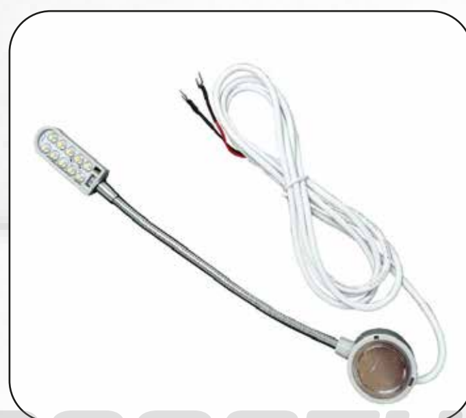
FOCO (10 LED) ART.17151